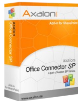
Finns för 2003/2007 och 2010

Produkten kan laddas ned från vår server. Testa i upp till 30 dagar utan kostnad. Pris: från 170 SEK/ användare och år.